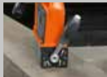
VYPNUTO 0% přídržná síla