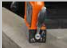
Předmagnetizace 30% přídržná síla