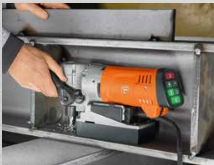
Blízko okrajů a v úzkých místech

FEIN KBC 35 nabízí se svou konstrukční výškou 169 mm a rohovým rozměrem 33 mm pohodlnou práci blízko krajů s dobrým výhledem na místo vrtání.