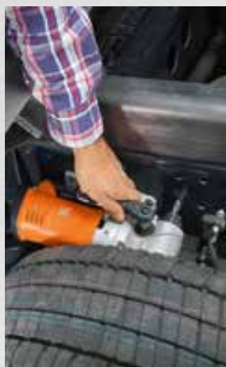
Optimální výhled na místo vrtání