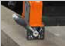
ZAPNUTO 100% přídržná síla