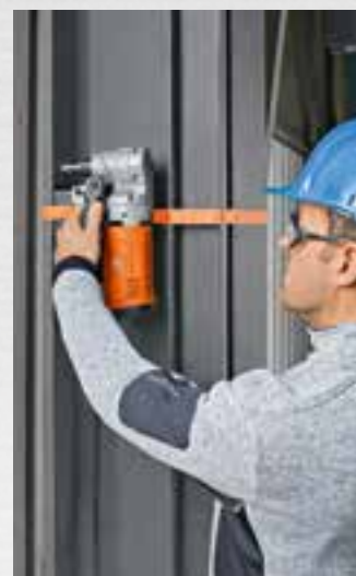
Také vertikálně a nad hlavou